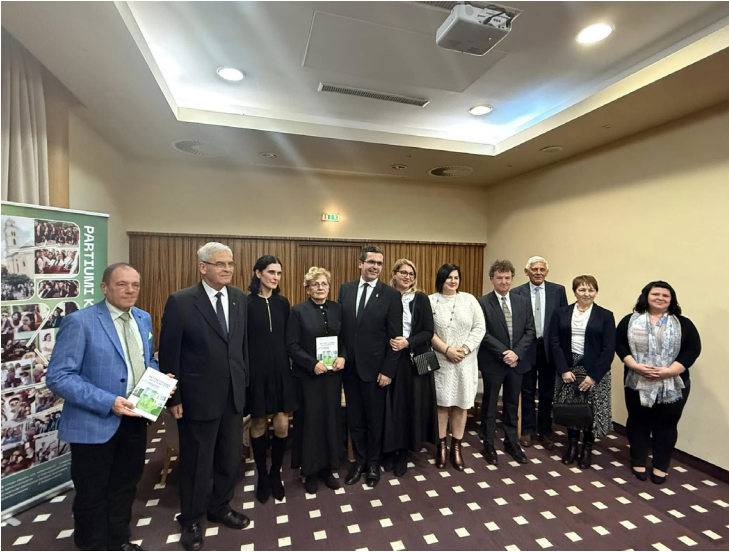
A budapesti könyvbemutató szereplői