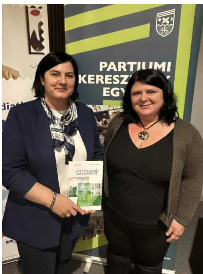
A két szerző a budapesti könyvbemutatón