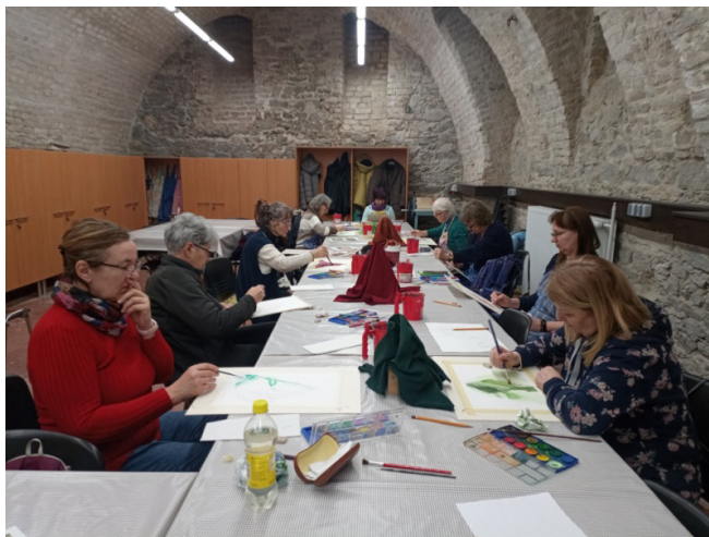
3. számú kép. Tanulmánykészítés közben

□ Időgazdálkodás / Mennyi időt szánnak a mű elkészítésére? Ilyen szempontból heterogén a csoport. Vannak, akik szeretnek hosszan, alaposan kidolgozni egy alkotást (lásd a 4-5. számú képeket), míg mások gyorsan a végére érnek, számukra az jelenti a sikerélményt. De ezt nagyban befolyásolja az is, hogy az adott napon, az adott foglalkozásra milyen hangulatban, mennyire fáradtan érkeznek és mihez éreznek kedvet. Jellemző, hogy kedvelik a gyors, azonnali eredményeket adó, látványos technikákat.