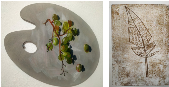
6-7. számú kép. Akriltanulmány, monotípiá

Gyakran megfigyelhető a korosztálynál a türelem hiánya, és ezáltal a felületesség, az elnagyolt alkotások készítése. Nehézséget okoz például a színkeverés, a megfelelő ecsetkezelés elsajátítása, ezáltal festés esetén a finom színátmenetek létrehozása nehéz a számukra. Többször tapasztaltuk, hogy inkább új műbe kezdett valaki, mintsem újra megpróbálta volna megfesteni az adott részletet. Mindazonáltal ez nem a teljes csoportra vonatkoztatható. A 6. és 7. számú képen példát láthatunk az alapos és a gyors munkára.