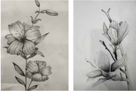
4-5. számú kép. Virágtanulmányok beállításról, grafit

alatt készül, míg egy akrilfestménynek órák kellenek. A technika nem megfelelő alkalmazása meghosszabbíthatja vagy lerövidítheti az alkotás idejét, amelyet fontos tudatosítani. Egy gyakran alkalmazott gyors technika a krokik rajzolása élő modelltől, amely mindig kihívást jelent a csoport tagjai számára. Az 5-10 perces, gyors rajzok készítése rendkívül hatékony a gátlások feloldásában, a lényeglátás fejlesztésében, a koncentrált figyelem elérésében, ámde egyszerre rendkívül frusztráló is az alkotó számára az öt szorongató idő miatt. Ennek ellenére fokozatos használata (először hosszabb idő, majd egyre kevesebb) rendkívül hatékony a kézügyesség fejlesztésében.