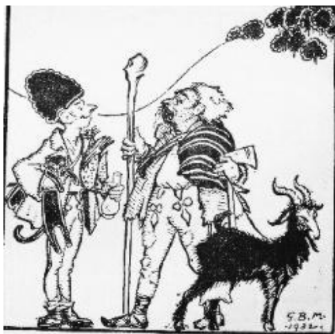
(Tamási Áron Ábel a rengetegben egyik illusztrációja, amit Bánffy Miklós készített)

A képek a történetekkel teljesen egybefonódnak, amihez jelentősen hozzájárul a figurák személyiségének a karikatúra jellegű ábrázolása, erre az egyik legjobb példa épp a főhős Ábel, aki fiatal létére kihúzza magát orrát az ég felé tartja és olyan magabiztosan áll, hogy senki sem vonná kétségbe bátorságát. Bánffy Miklós tollrajzai nem csak segítik elképzelni a nézőnek Ábel történeteit, hanem egyenesen életre keltik azokat. Az Ábel illusztrációk a szépen kidolgozottól egészen a groteszk felületekig minden változatot felsorakoztatnak, ezzel elevenítve meg a cselekmények dinamikáját (Tamási, 1932).