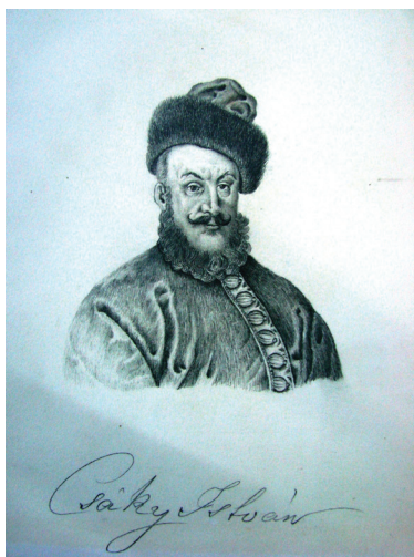
Csáky István tárnokmesterről ismeretlen által készített ceruzarajz, Elias Wideman 1650-ben készített metszete alapján (Gyulay Lajos gyűjteménye)

Bizonyos, hogy a két Csáky fivér nagy fordulatot hajtott végre, amikor az apai kezdeményezést folytatva kiköltözött Erdélyből a Magyar Királyságba, hogy ott indítsák újra karrierjüket. Ennek a lépésnek megtételét bizonyára siettetette, hogy Csáky István (1603–1662) Bethlen Gábor özvegyének, Brandenburgi Katalinnak nem csupán támogatója, hanem „szédítője” is volt, amivel az erdélyiek nemtetszése mellett I. Rákóczi György ellenszenvét is kivívta, aki egy időre birtokait elvette, őt magát pedig nem látta szívesen a fejedelemségben (Deák, 1875, 97.; Papp, 2012, 196.). Anyjának és testvéreinek azonban nem korlátozták tevékenységét. Csáky az erdélyi botrány után csak korlátozottan használhatta erdélyi birtokait, amit rokonai vettek tőle zálogba, ezért számára létfontosságú volt a királyságbeli birtokszerzés.